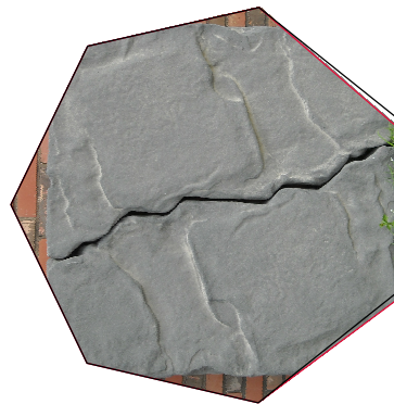
Przykładowe ukształtowanie powierzchni paneli wspinaczkowych